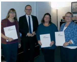
Kultusminister Tonne mit Vertreterinnen der Berufsvereinigung für Kindertagespflegepersonen

Hier die Pressemitteilung der Berufsvereinbarung im originalen Wortlaut: