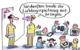
4. Fachtag für Tagespflegepersonen Digitale Medien im pädagogischen Alltag der Kindertagespflege: Chancen und Risiken 17. November 2018 in Hannover