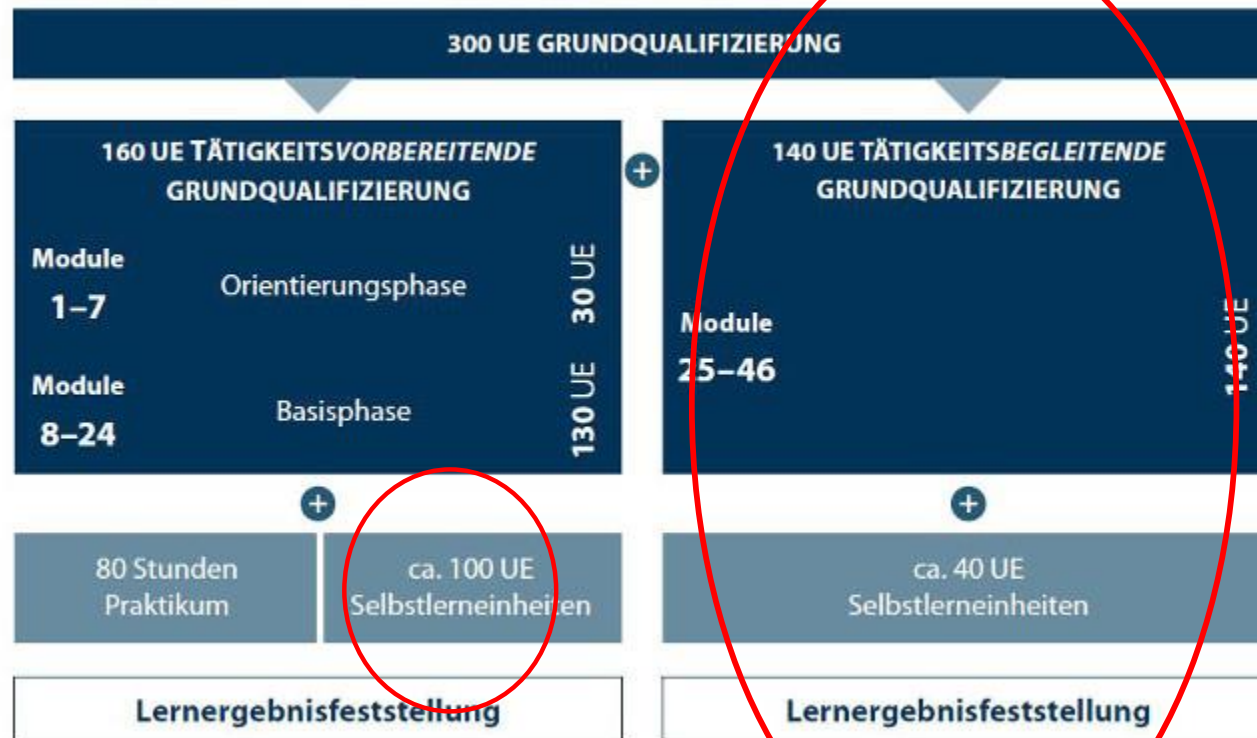
Abbildung: Aufbau der Grundqualifizierung nach dem QHB